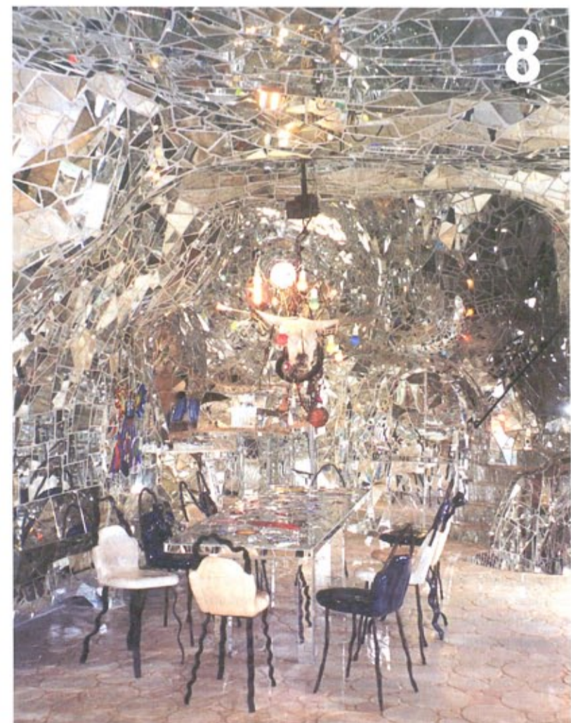
Giardino dei Tarocchi in Capalbio, Italië.