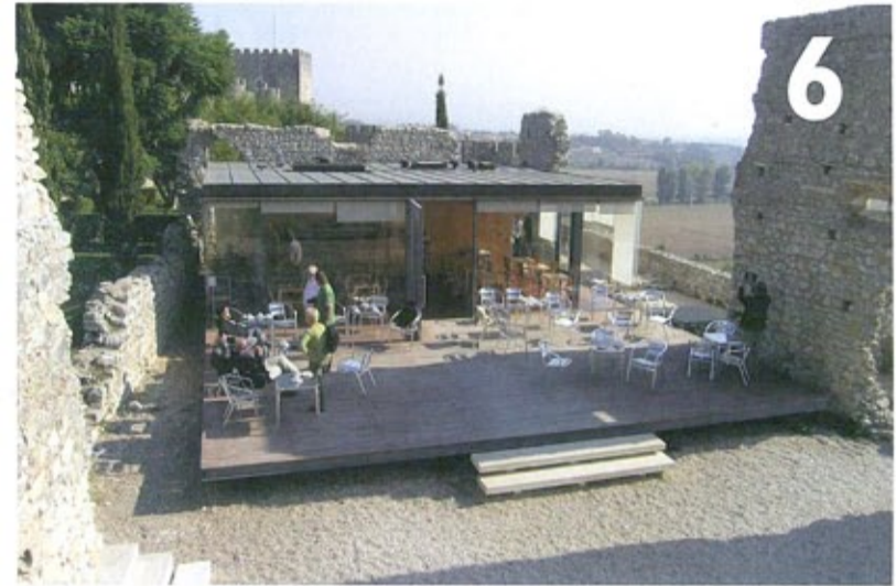
Theehuisje bij Montemor-o-Velho, Portugal.