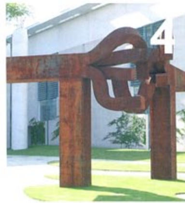
Beeld van Enrico Chillida in de tuin van het Bundeskanzleramt, Berlijn.