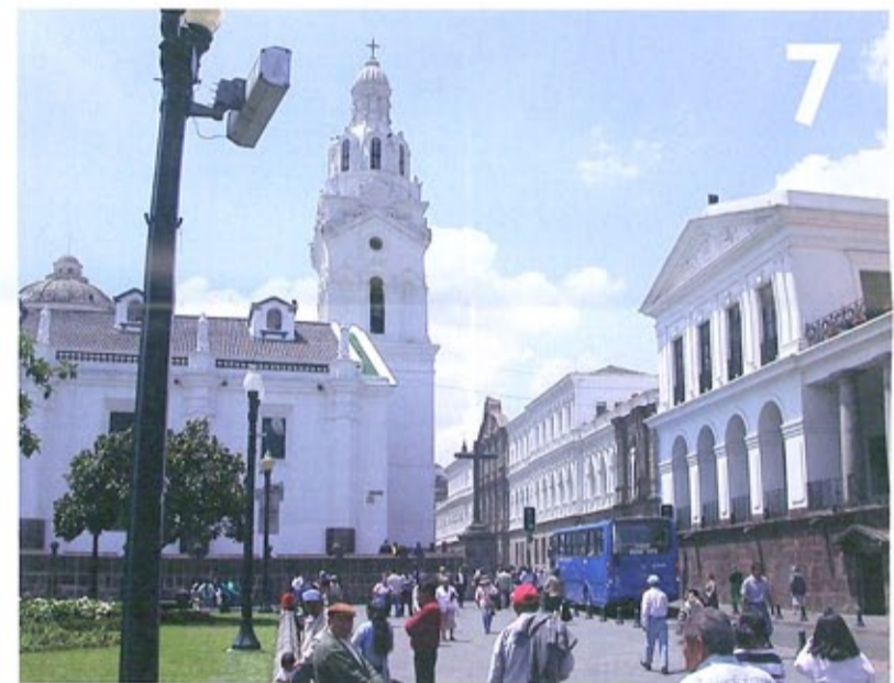
Straatbeeld Quito, Ecuador.